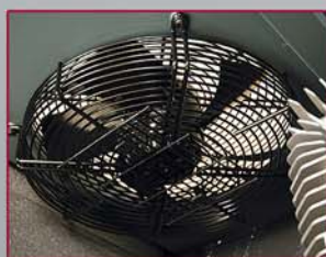
VENTILATORE Garantisce un ottimo raffreddamento anche in condizioni gravose di impiego.