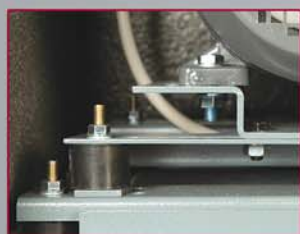
STRUTTURA AMMORTIZZATA Soppio supporto antivibrato per annullare le vibrazioni e ridurre la rumorosità.

Questa è installata su supporti con antivibranti per eliminare eventuali vibrazioni.