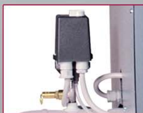
PRESSOSTATO Telepressostato con protezione termica.